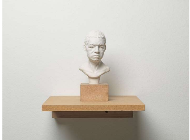
Thomas J Price, Mixed Feelings About Bus Drivers , 2004 © Thomas J Price, Courtesy the artist and Hauser & Wirth, Photo: Ken Adlard