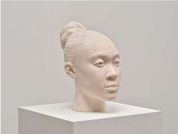
Thomas J Price, Through a Steady Gaze , 2023