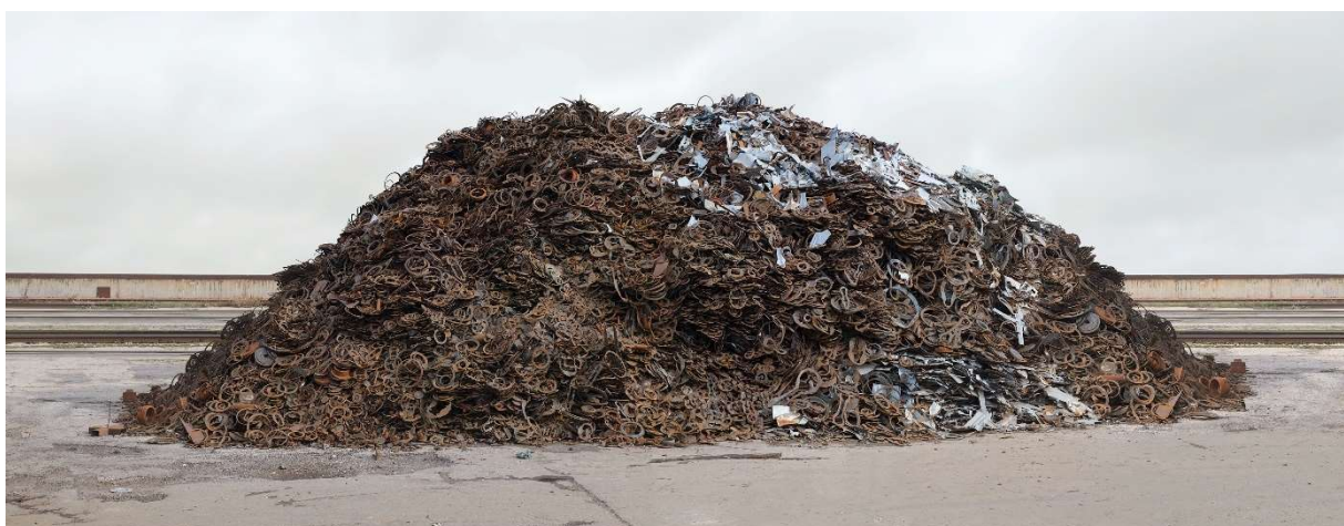
Gabriele Engelhardt, Metallringeburg Krems , 2023 © Gabriele Engelhardt